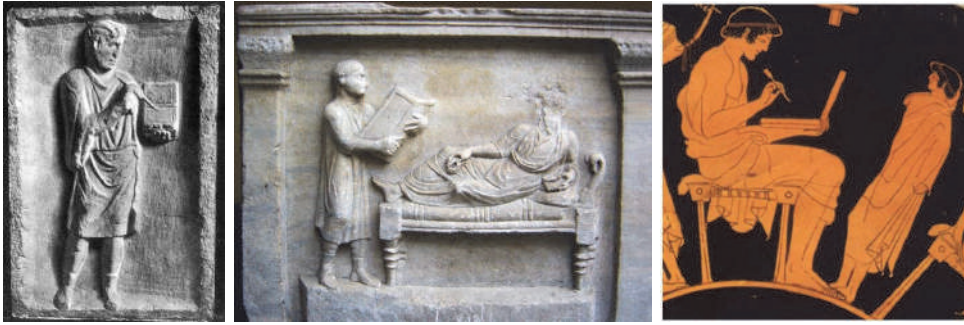
Рис. 2. Зображення писал і дощочок для письма на античних артефактах

кутах таких табличок робили отвори для шнура, яким одна табличка скріплювалася з іншою чи кількома, утворюючи на такий спосіб цілі невеликі зв'язки або книжечки – диптихи, триптихи і поліптихи. Практичність невеликих записів на церах полягала й у тому, що одна табличка часто переміщувалася між адресатами, які, прочитавши лист, загладжували написане і писали відповідь на тому ж полі. Популярність та масовість виготовлення таких середньовічних “ручок” і “зошитів” засвідчують не тільки археологічні знахідки, антична та середньовічна іконографія, а й повідомлення писемних джерел, які згадують про існування в XIII ст. цілих цехів майстрів воскових табличок 6 .