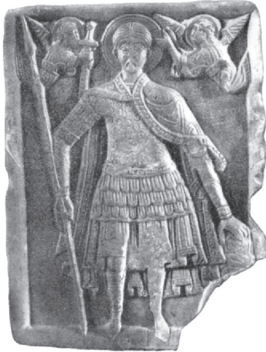
Рис. 9. Св. Дмитрій. Іконка з Бакоти, приблизно 1200–1250 рр. Кам'янець-Подільський історичний музей (за А. Кірпічниковим)

Очевидно, в галицько-волинських землях використовували наручі та поножі з поєднаних видовжених пластин 70 , як це можна прослідкувати на знайдений на Поділлі (Бакота?) іконці святого Дмитрія Солунського (Кам'янець-Подільський історичний музей-заповідник) (рис. 9) 71 . До подібного захисного гарнітуру могла належати й одна з пластин із фондів галицького заповідника ("НКЗ "ДГ") (рис. 10). Вона має видовжену форму з заокругленими краями з одного боку та поступовим звуженням з іншого. Найвний також монтажний отвір посередині і вигин звуженої сторони.