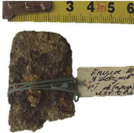
Рис. 5. Фрагмент пластинчатого обладунку з ур. Шевчуків, давнього Галича (Фонди НІКЗ "ДГ")

Особливої уваги заслуговує знахідка підквадратної пластини з Дорогобужа, на якій вміщено рельєфне тиснення 43 . Це може свідчити про імпорт із Чернігівської землі, де є підстави підозрювати осередок виготовлення таких тиснених пластин 44 . Хоча сам обладунок міг потрапити на Волинь й за інших обставин.