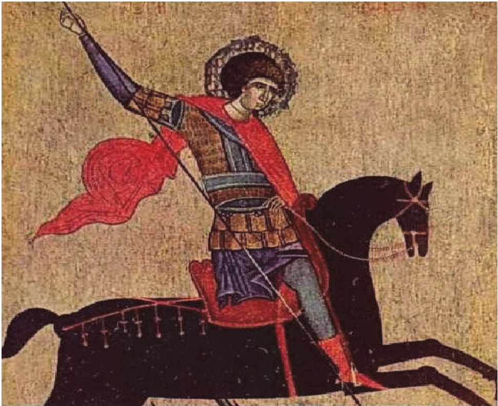
Рис. 7. Ікона Св. Георгій Змієборець. Друга половина XIV ст. З церкви Собору святих Йоакима і Анни в селі Станиля. НМЛ

До унікальних для регіону знахідок відноситься елемент рукавиці з боярської садиби в селі Якторів Львівського р-ну Львівської обл. Святослав Терський відніс його до XIII ст. 61 На наш погляд, судячи з датування низки аналогій, зокрема з поля битви 1361 р. біля Вісбю на о. Готланд 62 , елемент цілком може бути сприйнятий і в межах XIV ст.