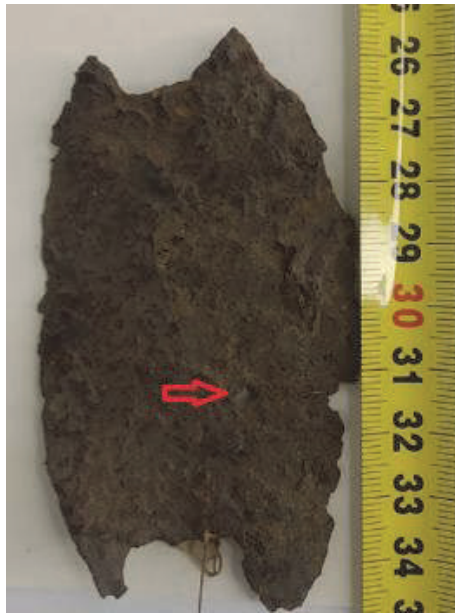
Рис. 10. Пластина обладунку з Крилосу (монтажний отвір у центрі) (Фонди НІКЗ “ДГ”) (фото автора)

скорлата . да бронь дощатые” 72 . Тут “броні дощаті” виступають не лише маркером озброєння феодальної верхівки, а й певним цінованим грошовим еквівалентом при торговій операції.