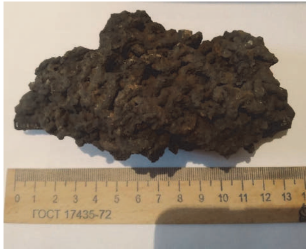
Рис. 3. Фрагмент спеченої кольчуги з Галича (ЛІМ № КР-16154)

на території Білорусі). Рештки двох кольчужних сорочок віднайдені також в Ізяславі 13 .