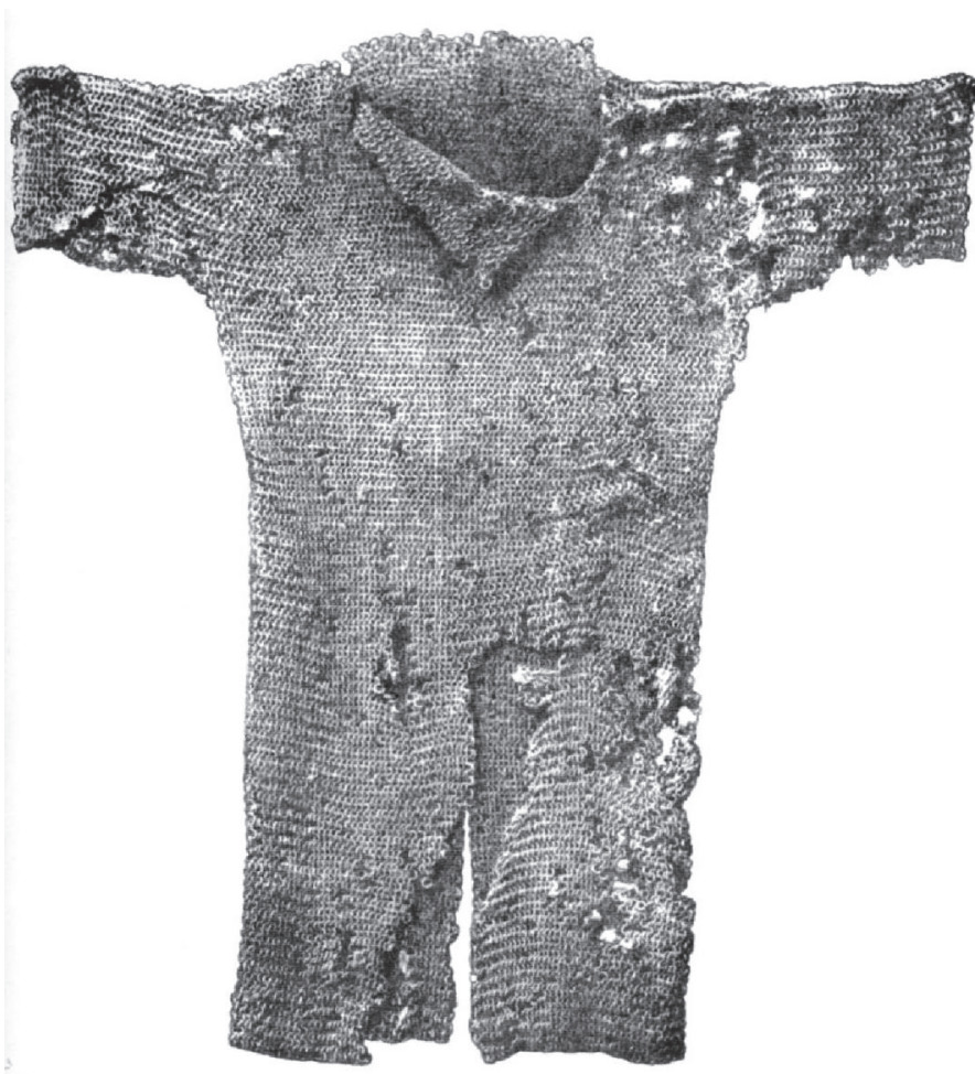
Рис. 1. Ціла кольчуга з колишнього Кременецького повіту (Волинь) (за А. Кірпічником)

цілих кольчужних сорочок X–XI ст. з курганів літописного Пліснеська 5 . До давніше віднайдених докладніше не задокументованих належать об'єкти з міста Володимира та села Вигаданка в його околицях 6 . Остання з них, вилучена з р. Буг, була виявлена разом із кістяком, шоломом та мечем 7 .