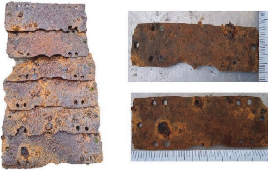
Рис. 8. Комплект ламелярних пластин з грабіжницьких розкопок на Львівщині

Подібні до литовської знахідки і пластини, знайденої на Львівщині, можна простежити також на зній іконі кінного святого Георгія з церкви Собору святих Йоакима і Анни в с. Станія Дрогобицького р-ну Львівської обл. (Національний музей у Львові імені [митрополита] Андрея [(Шептицького)]) 65 та іншій репліці того ж зразка – з церкви Перенесення мощів святого Миколая у селі Старий Кропивник того ж району (Львів, Музей митрополита Андрея Шептицького) 66 , де подано пластини, мінімально накладені одна на одну, а відтак, імовірно, їх подібним способом прикріплено шнурівкою із багатьох сторін. Цікаво, що на зображенні такий захист, набраний так само з пластин, поширюється водночас також і на плечі (рис. 7).