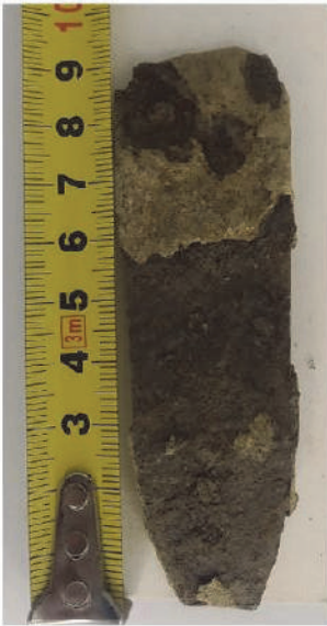
Рис. 4. Пластина (рондель?) з Крилосу (Фонди НІКЗ "ДГ")