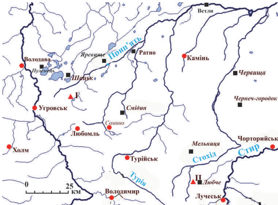
Рис. 1. Мапа Західного Полісся. Квадратом позначено досліджувані в різний час укріплені поселення під сучасною назвою. Трикутником позначені знахідки згаданих у статті великих скарбів монет X ст. (I – околиці Любомля, II – Доросині)

високий рівень суспільного розвитку Західного Полісся на момент включення його до складу Київської держави. У цьому сприймається певна специфіка зазначеного регіону.